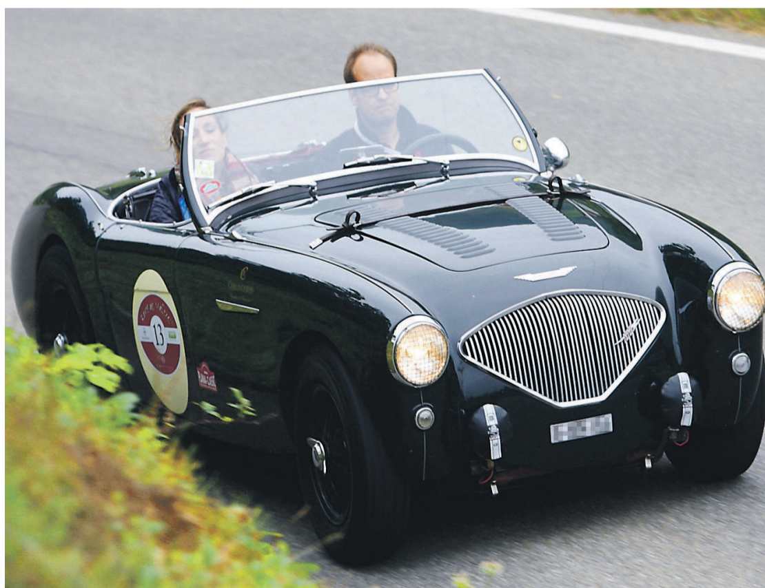
Auch historische Automobile können durchaus eine lukrative Geldanlage sein.